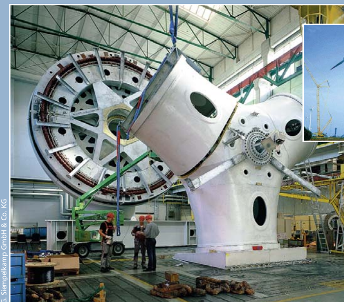
Energie- und Umwelttechnologie

Diese Vielfalt zeigt schon: Der Maschinenbau ist eine große und wichtige Branche in der deutschen Wirtschaft. Viele, viele kleine und mittlere Maschinenbau-Betriebe stellen zusammen die meisten Industriearbeitsplätze in Deutschland. Da sie mehr als 70 Prozent ihrer Produkte in andere Länder verkaufen, verhalfen sie Deutschland seit Jahren zum Titel „Exportweltmeister“.